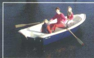
Rhea 380 classic

De Rhea 380 heeft vele gunstige eigenschappen en is modern vormgegeven. Heeft zowel voor als achter opbergruimte en een polyester roeibankje. Voor de sportievelingen onder ons is het van belang om te weten dat met deze boot ook heel goed te roeien is. De Rhea 380 is leverbaar in twee verschillende uitvoeringen. De Rhea 380 standaard in de kleur ivoor en met een kunststof stootband. De Rhea 380 classic is voorzien van een kabelaring en de romp is leverbaar in de kleuren rood, groen of blauw.