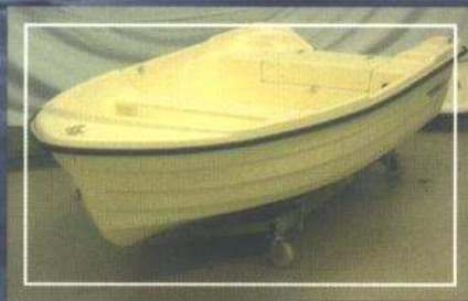
Rhea 380 standaard

De Rhea 380 is uitstekend te gebruiken als comfortabele toer-, vis- of volgboot.