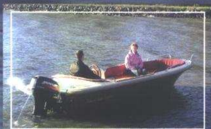
Rhea 510 elegance met stuurpaal en luxe kussenset incl. rugkussens

Het vlaggenschip uit de Rhea-boten lijn.