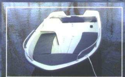
Rhea 430 met kussenset, voorrailing en stuurconsole