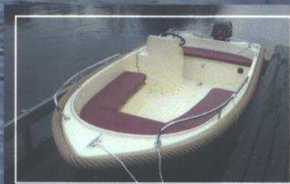
Rhea 460 met kussenset